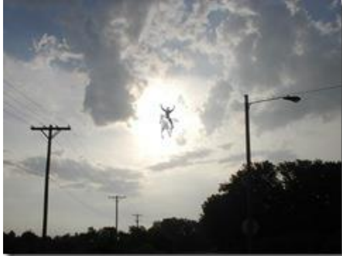
Obra de arte de Duncan Long

Este mensaje fue presentado para que supiera lo que está a punto de suceder con respecto a la venida del Señor por Su Iglesia. Si aún no conoce al Señor Jesús, ahora es el momento de tomarlo como su Señor y Salvador. Jesús quiere que seas uno de sus hijos que estará listo para cuando Él nos llame al cielo. ¿Cómo prepararse? Al pedirle a Jesús que le perdone sus pecados, dígame que cree en Su palabra y ahora cree que Él se levantó de la tumba en tres días tal como nos dijo que lo haría. Cristo fue al cielo para preparar un lugar para todos aquellos que tuvieron fe en Él como su Señor. No se quede atrás cuando Jesús elimine Su Iglesia. Si te quedas atrás, tendrás que lidiar con el reino del Anticristo, que solo durará siete años. El Anticristo viene a destruir a todos los que pueda y Jesús quiere sacarte de los actos del Anticristo, hombre. ¿Entregarás su vida al Señor hoy? ¡Te ruego que lo hagas!