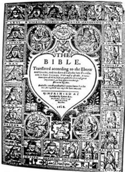
→ 1608 GENEVA BIBLE

3 * Let no man deceiue you by any meanes: for that day shall not come, except there come a departing first, and that that man of sinne be disclosed, euen the sonne of perdition.